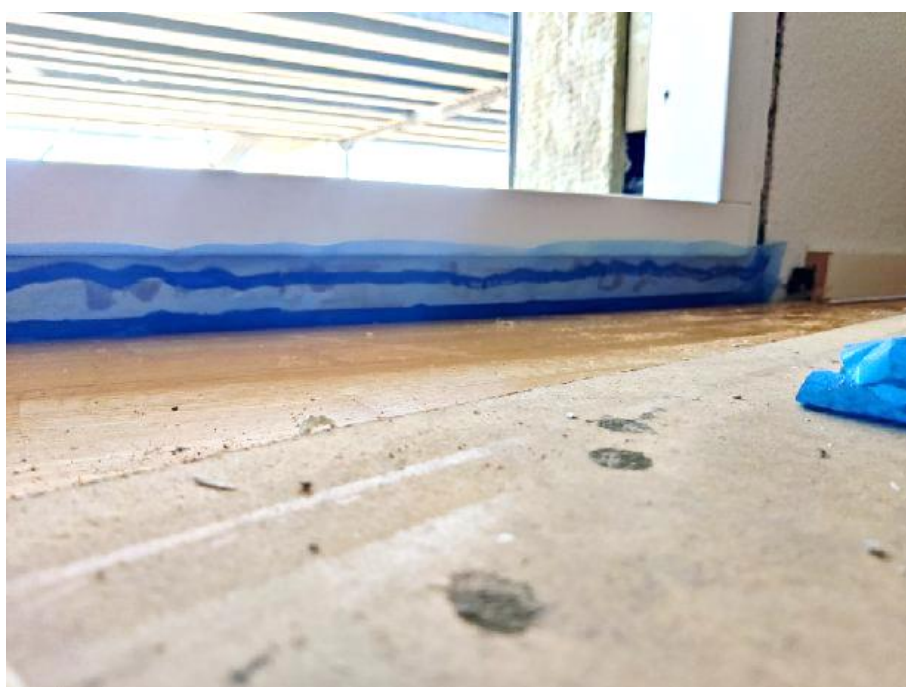
Foto: Langs bundkarmen, etableres tætning med folieklæber og PE-folie.