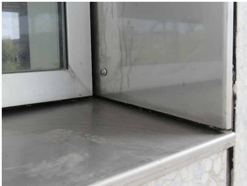
Foto: Afslutning langs bunden.