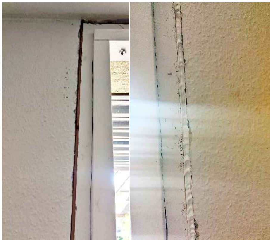
Foto: Fræset fals med MS Polymerfuge som indvendig tætning. Fugemassen glittes efterfølgende.