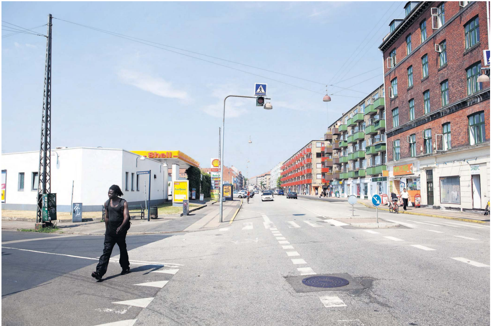
Sammenblandingen af de klassiske almennyttige boligblokke fra 30'erne og småindustri er kendetegnende for Nordvest.

Vi kommer forbi et designfirma. Der holder en Porsche i den åbne baggård. Over for er der en tom grund med vilde blomster.