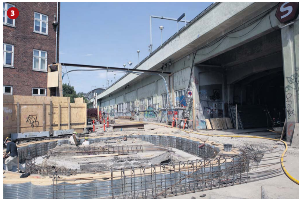
3 Buerne under højbanen ved Nørrebro station kunne ifølge arkitekten med fordel åbnes op og gøres til små selvstændige byrum. På den måde kunne afhjælpe sociale problemer i området.

Måske er Nordvestkvarteret ikke så hipt som Vesterbro og Indre Nørrebro, der er ved at drukne i caféer og smarte unge mennesker med barnevogne og de rigtige solbriller. Men det kan det blive, for der sker ting og sager i derude hele tiden.