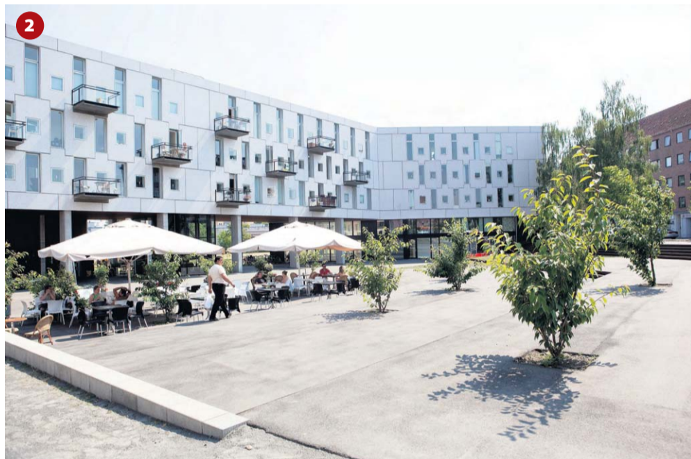
2 Arkitektonisk trick. Den vestvendte plads foran boligbyggeriet Emaljehaven er blevet sænket i forhold til den trafikerede vej, så støjen ikke generer så meget.